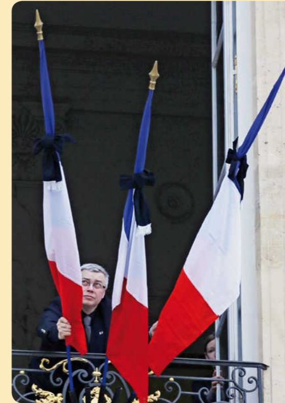
Cet homme plie des drapeaux au palais de l'Élysée.