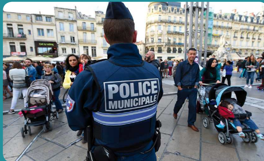
Un policier surveille une place de Montpellier, dans l'Hérault (sud de la France), samedi