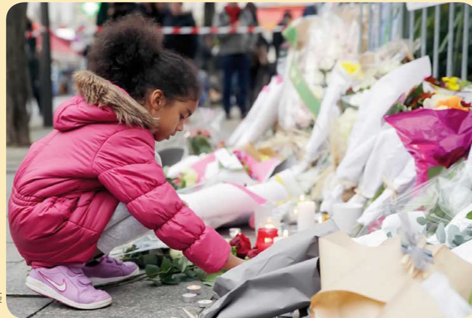
Des hommages. Des personnes déposent des bougies ou des fleurs devant les lieux des attaques ou dans d'autres endroits de Paris.

Dans le monde. Des monuments ont été éclairés aux couleurs du drapeau français. Ici, l'opéra de Sydney, en Australie (Océanie).