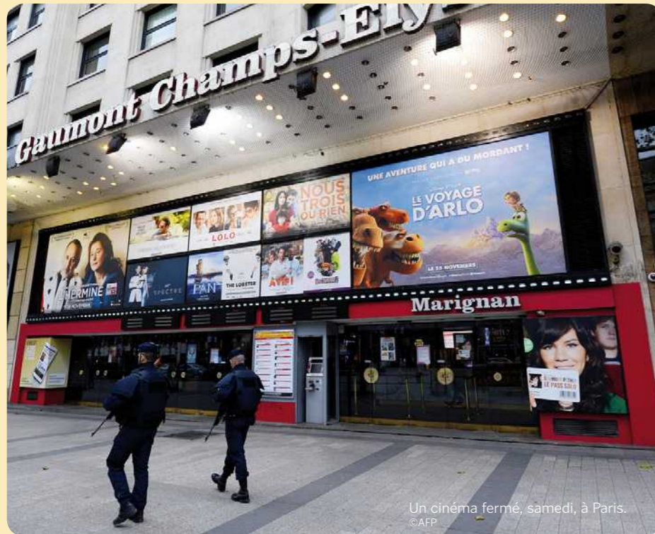
Un cinéma fermé, samedi, à Paris.